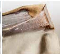
Schmelzen der Nässesperre durch Hitze von außen