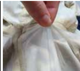
Delamination / Ablösen der Membrane vom Trägermaterial